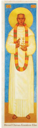
Blessed Chavara Kuriakose Elias