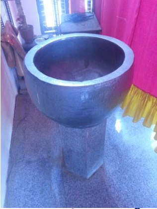
ചാവറ അച്ചൻ മാമ്മോദീസ മുങ്ങിയ മാമ്മോദീസാ തൊട്ടി