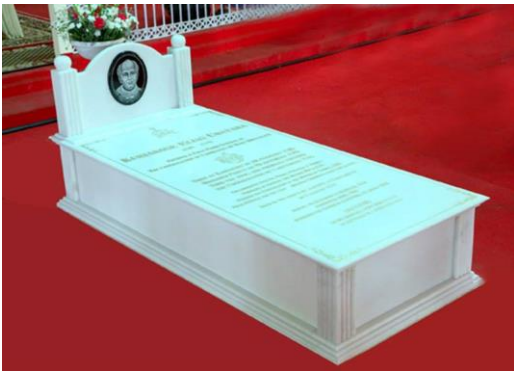
ചാവറ അച്ഛന്റെ കബറിടം

‘കൺ മുമ്പിൽ കാണപ്പെട്ട നന്മകൾ മുഴുവനും ചാവറ പിതാവ് ചെയ്തു’.