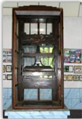
ചാവറ പിതാവ് സ്ഥാപിച്ച മരം കൊണ്ടുള്ള പ്രസ്സ്

പിന്നീട് ദീപിക ദിനപ്പത്രവും, 'കർമ്മല കുമ്പസാരം' കുടുംബ മാസികയും ഈ പ്രസ്സിൽ നിന്നും പുറത്തു വന്നു.