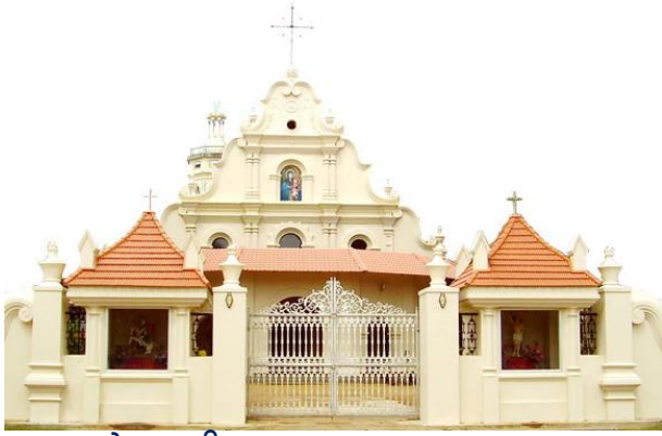
വെച്ചൂർ മുത്തിയുടെ ദേവാലയം

സ്വന്തം അമ്മയെപ്പറ്റി ചാവറ അച്ചൻ പറയുന്നത്: 'എന്റെ പ്രിയപ്പെട്ട അമ്മയാണ് എന്റെ ആദ്യ ഗുരുനാഥ. ഈ അമ്മയ്ക്ക് ദൈവം നൽകിയ സ്നേഹം അമ്മ എന്നിലേക്ക് പകർന്നു തന്നു. മുലപ്പാലിനൊപ്പം പ്രാർത്ഥനയുടെ മാധ്യമ്യവും ഞാൻ ആസ്വദിച്ചു. അർത്ഥം ഗ്രഹിക്കാറായപ്പോൾ ആവശ്യമായ വേദപാഠമെല്ലാം പറഞ്ഞുതന്ന് അമ്മ എന്നെ പഠിപ്പിച്ചു. എന്റെ അമ്മയുടെ പാദത്തിൽ ഇരുന്നാണ് ഞാൻ ദൈവത്തെ അറിയുവാൻ തുടങ്ങിയതും അനുഭവിച്ചതും. പാതിരാത്രിയിൽ ഉറക്കമുണർന്ന് എന്റെ അമ്മ മുട്ടിമേൽ നിന്ന് പ്രാർത്ഥിക്കുമായിരുന്നു. ഉണരാനിടയാൽ ഞാനും അമ്മയോടൊപ്പം കൂടും. വാക്കുകൾ ഉച്ചരിക്കുവാൻ തുടങ്ങിയപ്പോൾ ദൈവ നാമം എന്നെ പഠിപ്പിച്ചു. നന്നേ ചെറുപ്പത്തിൽ അമ്മ എന്നെ വെച്ചൂർ പള്ളിയിൽ കൊണ്ടുപോയി എല്ലാ വർഷവും ദൈവ മാതാവിന് അടിമ വയ്ക്കും. പരി. അമ്മയുടെ മുമ്പിൽ മുട്ടുകുത്തി അമ്മ ഇങ്ങനെ പ്രാർത്ഥിച്ചു: 'എന്റെ ഉദര ഫലമായ ഈ കുഞ്ഞിനെ നിന്റെ കാൽക്കൽ സമർപ്പിക്കുന്നു. നിന്റെ ദാസനായി ഇവനെ നീ കാത്തുകൊള്ളണം'. (ആത്മാനുതാപം)