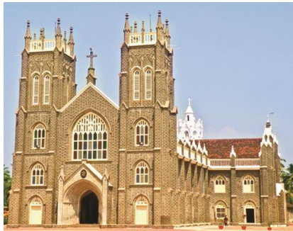
ചാവറ പിതാവ് തിരുപ്പട്ടമേറ്റ അർത്തുകൽ ദേവാലയം

1829 -ൽ നവംബർ മാസം 29 - നു ചാവറ അച്ചൻ അർത്തുകൽ വി. അന്ത്രയോസ് ശ്ലീഹായുടെ ദേവാലയത്തിൽ വച്ച് ഇരുപത്തി നാലാം വയസ്സിൽ അഭിവന്ദ്യ മൌരേലിയൂസ് സ്ഥബിലീനി മേത്രാനിൽ നിന്നും വൈദിക പട്ടം സ്വീകരിച്ചു.