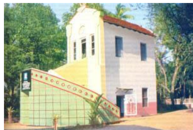
കൂനമ്മാവിൽ ചാവറ അച്ചൻ ഉപയോഗിച്ചിരുന്ന മുറി

1860 -ൽ സ്ത്രീകൾക്കായി സന്യാസിനി സഭ ആരംഭിക്കുന്നതിനുള്ള ചർച്ചകൾ ലെയോപോൾദു മിഷനറിയുമായി നടത്തുന്നു.