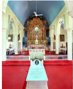
മാനാനം ദേവാലയത്തിലെ ചാവറ പിതാവിന്റെ കബറിടം

1889 -ൽ കൂനമ്മാവിൽ സംസ്കരിച്ച ചാവറ അച്ചന്റെ ഭൗതികാവശിഷ്ടങ്ങൾ മാനാനം ആശ്രമ ദേവാലയത്തിലേക്ക് മാറ്റി സ്ഥാപിച്ചു.