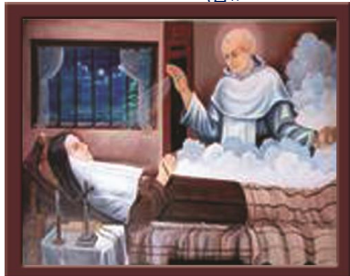
വിശുദ്ധ അൽഫോൻസാമ്മക്ക് ചാവറ പിതാവിൽ നിന്നും രോഗശാന്തി ലഭിക്കുന്നു

വി. അൽഫോൻസാമ്മക്കു ലഭിച്ച രോഗശാന്തി: ചില രോഗങ്ങളാൽ അത്യധികം സഹിച്ചപ്പോൾ അൽഫോൻസാമ്മ ചാവറ അച്ചനോട് പ്രാർത്ഥിക്കുകയും ചാവറ അച്ചൻ അൽഫോൻസാമ്മക്ക് സ്വപ്നത്തിൽ പ്രത്യക്ഷപ്പെടുകയും ആ രോഗങ്ങളിൽ നിന്നും സൌഖ്യം നൽകുകയും ചെയ്തു. അൽഫോൻസാമ്മ തന്നെ ഈ അത്ഭുത രോഗശാന്തിയെപ്പറ്റി എഴുതി സാക്ഷ്യപ്പെടുത്തിയിട്ടുണ്ട്.