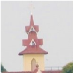
മാന്നാനം ദേവാലയത്തിലെ മണിമാളിക

മാന്നാനം പള്ളിയിലെ പ്രധാന അൾത്താരക്കു ലഭിച്ച ഒരു പ്രത്യേക ആനുകൂല്യം: പരി. ഒൻപതാം പിയൂസ് മാർപ്പാപ്പ, 1860 -ൽ ചാവറ അച്ചന്റെ അപേക്ഷ പ്രകാരം മാന്നാനം പള്ളിയിലെ വലിയ അൾത്താരക്കു 'പ്രിവിലേജിയം' എന്ന പ്രത്യേക പദവി നൽകുകയുണ്ടായി. ഇതിന്റെ പ്രത്യേകതകൾ: ഈ അൾത്താരയിൽ വി. കുർബാന അർപ്പിക്കുന്ന വൈദികനും, വിശ്വാസികൾക്കും പൂർണ്ണ ദണ്ട വിമോചനം ലഭിക്കുകയും പ്രത്യേക അനുഗ്രഹങ്ങളും ലഭിക്കും. പ്രധാനമായി മരണമടഞ്ഞവർക്ക് വേണ്ടി വി. കുർബാന അർപ്പിക്കുമ്പോൾ അവരുടെ ആത്മാവ് എല്ലാ പാപത്തിൽ നിന്നും മോചിതരായി സ്വർഗ്ഗ ഭാഗ്യം നേടുകയും ചെയ്യും.